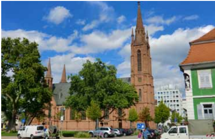
Dom des Rieds

die Domgasse zur Kirche der evangelischen Lukaskirche, auch als Dom des Rieds bekannt. Sie wurde 1863–1868 errichtet, 1944 bis auf den großen Turm zerstört und 1955/56 mit schiefergedecktem Dach wieder aufgebaut. Das Innere ist geprägt vom nüchternen Stil der Nachkriegszeit, die drei farbigen Chorfenster erzählen Geschichten aus dem Leben Jesu.