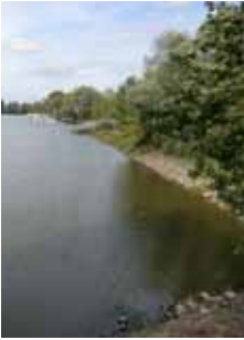
Altrhein von der Biedensandbrücke

manns, der auch Namensgeber des Vorplatzes ist, besitzt nach Westen eine auffällig gestaltete dreieggliederte Fassade mit rechteckigem Turm und Zwiebelhelm. Das Langhaus der Barockkirche ist mit einem Satteldach versehen. Im Innern befindet sich ein großes Altarbild mit St. Michael als Drachentöter und ein Beichtstuhl von 1750 aus Walldürn. Die Kreuzigungsgruppe rechts ist der Entstehungszeit der Kirche zuzuordnen.