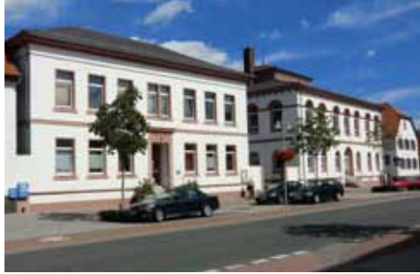
Katholisches und evangelisches Schulhaus

Gedenkstätte für die Gefallenen der Weltkriege (Oskar Veltmann, 1934), wo zwei übergroße Soldatenfiguren aus Muschelkalk Ehrenwache halten. Im weitläufigen Park, der seit 1960 in dieser Form genutzt wird, gibt es eine Vielzahl von Erholungsmöglichkeiten für Jung und Alt, sowie Fitnessgeräte für Senioren und ein Café. Zentral fällt das 2011 errichtete Hochzeitstor auf, das Hochzeitspaaren die Möglichkeit eines repräsentativen Fotos gibt.