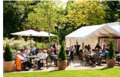
Café im Stadtpark

und dann in den Verwaltungsbereich integriert. Die Kaiserstraße mündet hier in die Ernst-Ludwig-Straße, in die wir schräg rechts einbiegen. Die Mehrzahl der Villen entstammen der Zeit um 1900 . Nach etwa 50 Metern wenden wir uns nach rechts in die Martin-Kärcher-Straße und kommen zum Stadtpark , der ehemals Teil des 1845 angelegten Friedhofs war, wie an einigen noch erhaltenen Grabsteinen zu erkennen ist. Gleich von der Straße aus fällt der Blick auf die