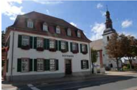
Altes Rathaus und St. Andreas

Geokoordinaten Startpunkt 49.594876, 8.468759