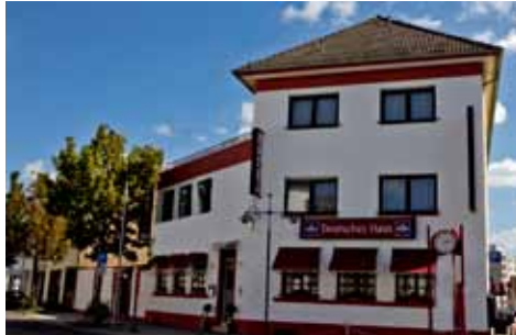
Restaurant Deutsches Haus

Weitere Informationen zum Deutschen Haus Hotel-Restaurant siehe S. 214