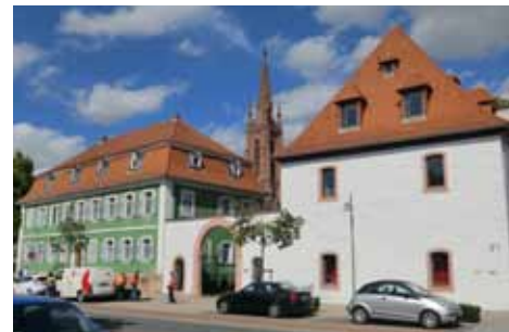
Zehntscheuer und Rentamt

in Richtung Europaplatz zurück. Links bemerken wir bei Nr. 12 das Haus Herweck von 1738 mit einfachem Fachwerk im Erdgeschoss und Zierfachwerk im Giebel. In dem Fachwerkhaus von 1737 in der Römerstraße 21 ist heute das Heimatmuseum eingerichtet. Es ist ein ehemaliges Bauerngehöft mit Stallung und Scheune. Auch ein völlig erhaltenes Backhaus ist in der Außenanlage zu besichtigen. Weiter die Straße entlang liegt links bei Nr. 26 ein Mitte des 18. Jahrhunderts erbautes Fachwerkgebäude mit dahinterliegender Fachwerkscheune. Auch am hellgestrichenen Gebäude Nr. 44 von 1740 kann man Fachwerk erkennen. Bei den klassizistischen Gebäuden Nr. 35 und Nr. 39 aus der Mitte des 19. Jahrhunderts handelt es sich um das frühere evangelische und das ehemalige katholische Schulhaus . Beide Gebäude haben Sandsteingewände. Auffällig ist der prunkvollere Baustil der evangelischen Schule und die kleine Glaskuppel als Spitze des Walmdaches. Bei Nr. 43 sehen wir das Gasthaus Krone , das im Kern auf die Zeit um 1680 zurück geht. Das Fachwerk des Gebäudes mit verschindeltem Giebel stammt von einem Umbau Mitte des 19. Jahrhunderts. Bei Nr. 51 liegt die 1770 aus