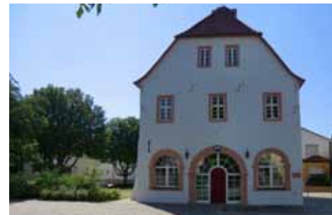
Altes Rathaus Hofheim

Ein Königshof (Frohnhof), eine Kirche und 24 dazugehörige Bauernhöfe können als Ausgangspunkt einer dauerhaften Besiedlung Hofheims angesehen werden, woran das von der Frohnhofstraße umschlossene Gebiet erinnert. Die katholische Pfarrkirche St. Michael , erbaut 1747–50 nach Plänen Balthasar Neu-